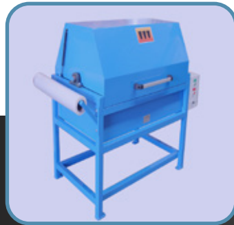
Sala de ensayos al fuego