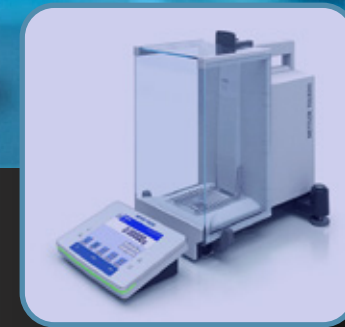
Sala de balanzas analíticas

Haz clic en la imagen y descubre todo lo que tenemos para tu empresa