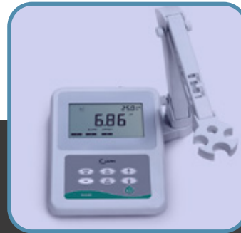
Sala de instrumentación