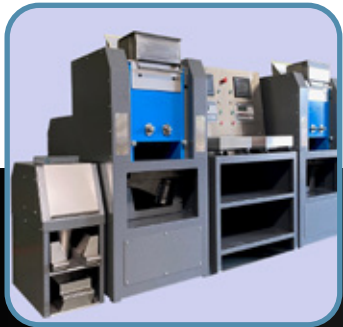
Sala de preparación de muestras

Ofrecemos una amplia gama de equipos tecnológicamente avanzados, cuidadosamente seleccionados para ayudar a los laboratorios mineros a realizar análisis precisos, eficientes y de calidad. Proveemos los equipos de las siguientes categorías: