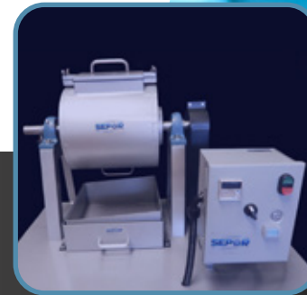
Sala de metalurgia