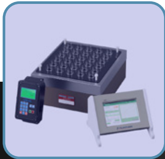
Sala de Digestiones Químicas